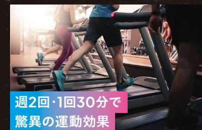
週2回・1回30分で 驚異の運動効果