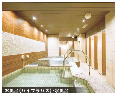
お風呂(パイラバス)・水風呂