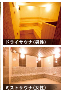
ドライサウナ(男性)