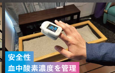
安全性 血中酸素濃度を管理