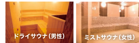
ドライサウナ(男性)